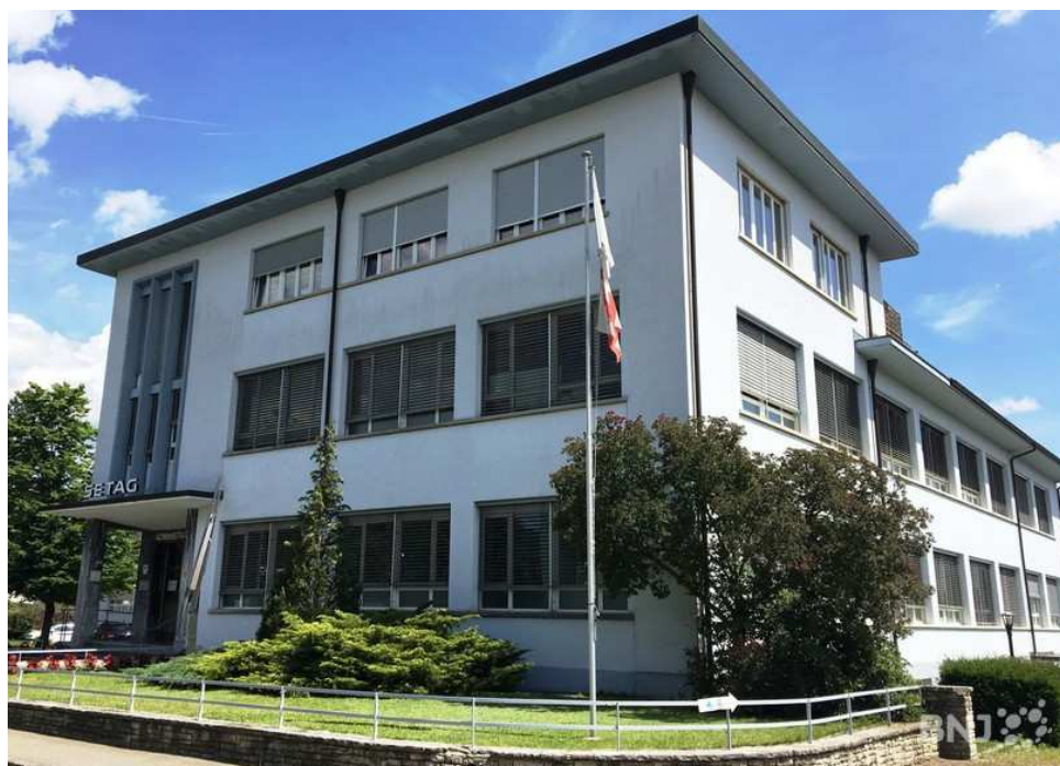
L'administration communale de Haute-Sorne

Les comptes 2017 bouclent sur un bénéfice de plus de 375'000 francs, le budget prévoyait un déficit mais des recettes fiscales supplémentaires ont notamment changé les prévisions