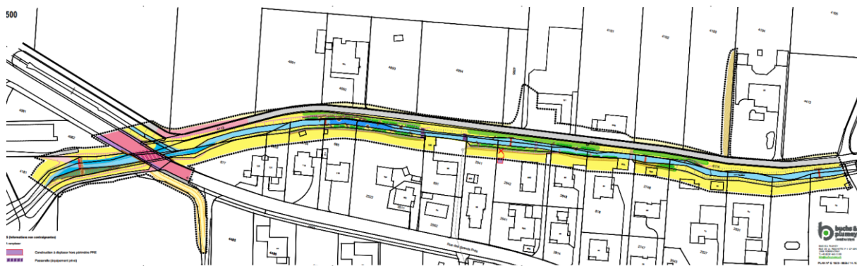
Extrait du plan des équipements déposés publiquement