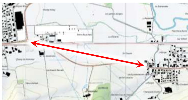
Figure 2 : Schéma de principe de l'interconnexion Bassecourt – Courfaivre, tracé définitif restant à définir

L'étude globale de l'approvisionnement en eau potable de Haute-Sorne, par son PGA (Plan Général d'Alimentation), avant même les problèmes survenus cette année, prévoyait la construction d'une nouvelle conduite de transport entre Bassecourt et Courfaivre. Le diamètre intérieur sera de 180mm au minimum.