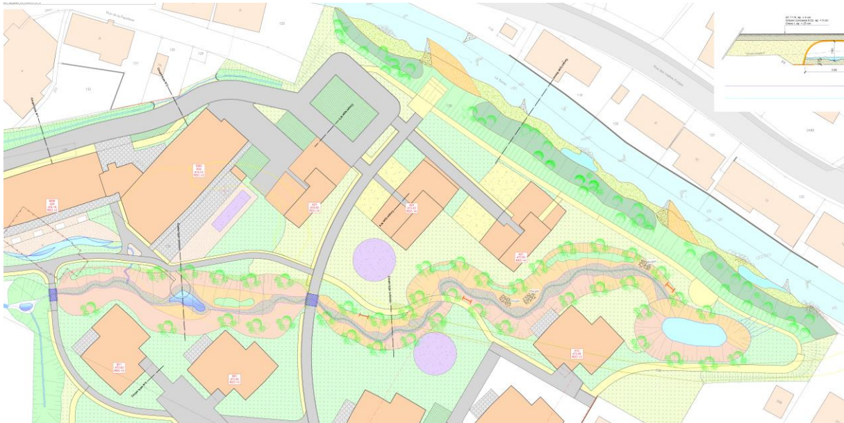
Extrait du plan de situation

Le projet de revitalisation a été conçu pour permettre à la faune et la flore locales de se développer dans les meilleures conditions possibles. En termes de renaturation, la berge droite de la Sorne sera adoucie et végétalisée, le cordon boisé sera recréé avec des essences locales, des plantations aquatiques seront introduites et le cours d'eau sera aménagé afin de garantir un développement optimum pour les poissons.