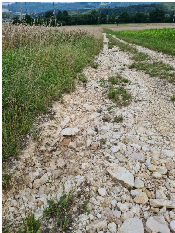
Chemin Perrerrattes Courfaivre

Les chemins en groise, représentant quasiment 35 km linéaires ont particulièrement souffert des intempéries de l'été 2021. Leur valeur à neuf est estimée à CHF 6'250'000.- environ.