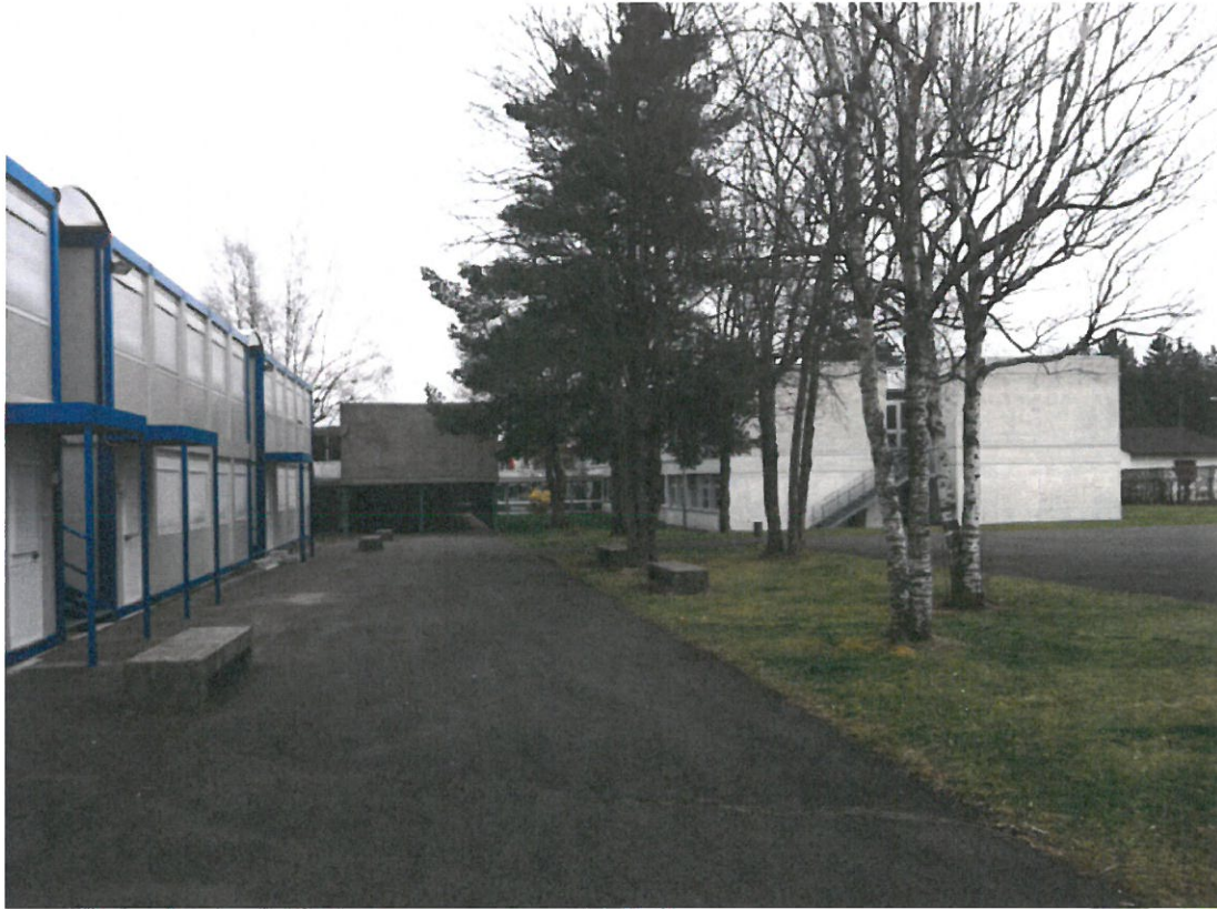
Vue d'ouest vers l'est ; à gauche les 6 containers à remplacer, au fond, les bâtiments actuels