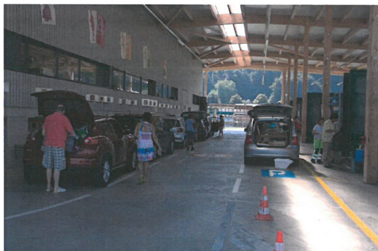
Image : la déchèterie régionale d'Yverdon

Le Conseil général avait émis le désir de se prononcer lorsque le crédit global serait adopté par le peuple.