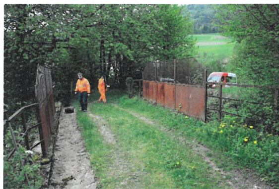
Figure 2 : Vues du passage supérieur