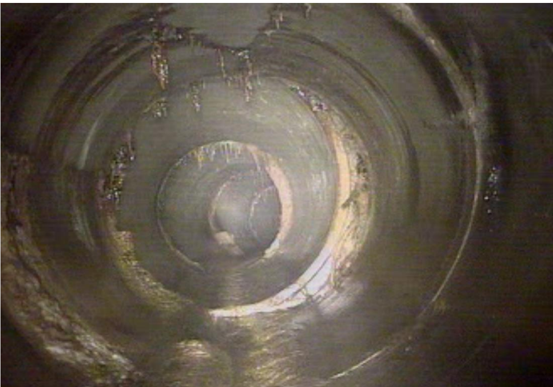
Décalage des anneaux en béton et contact avec les déchets.