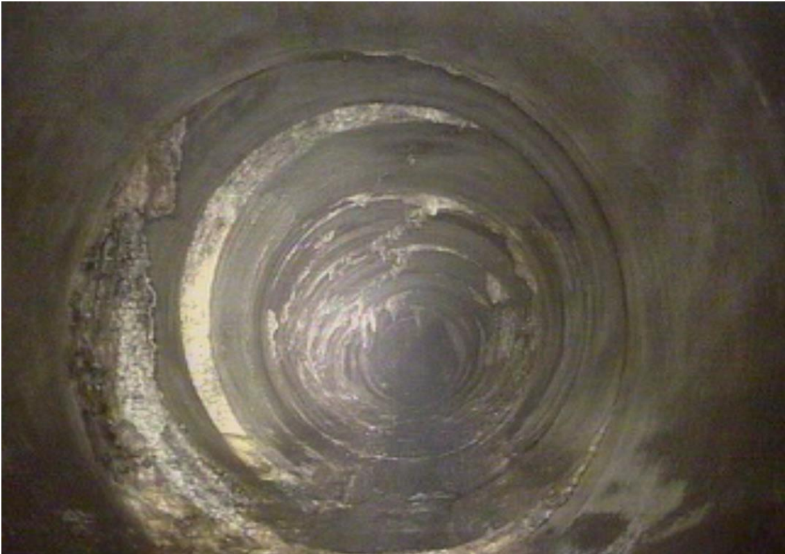
Décalages des anneaux en béton, contact avec les déchets et écrasement de la conduite.