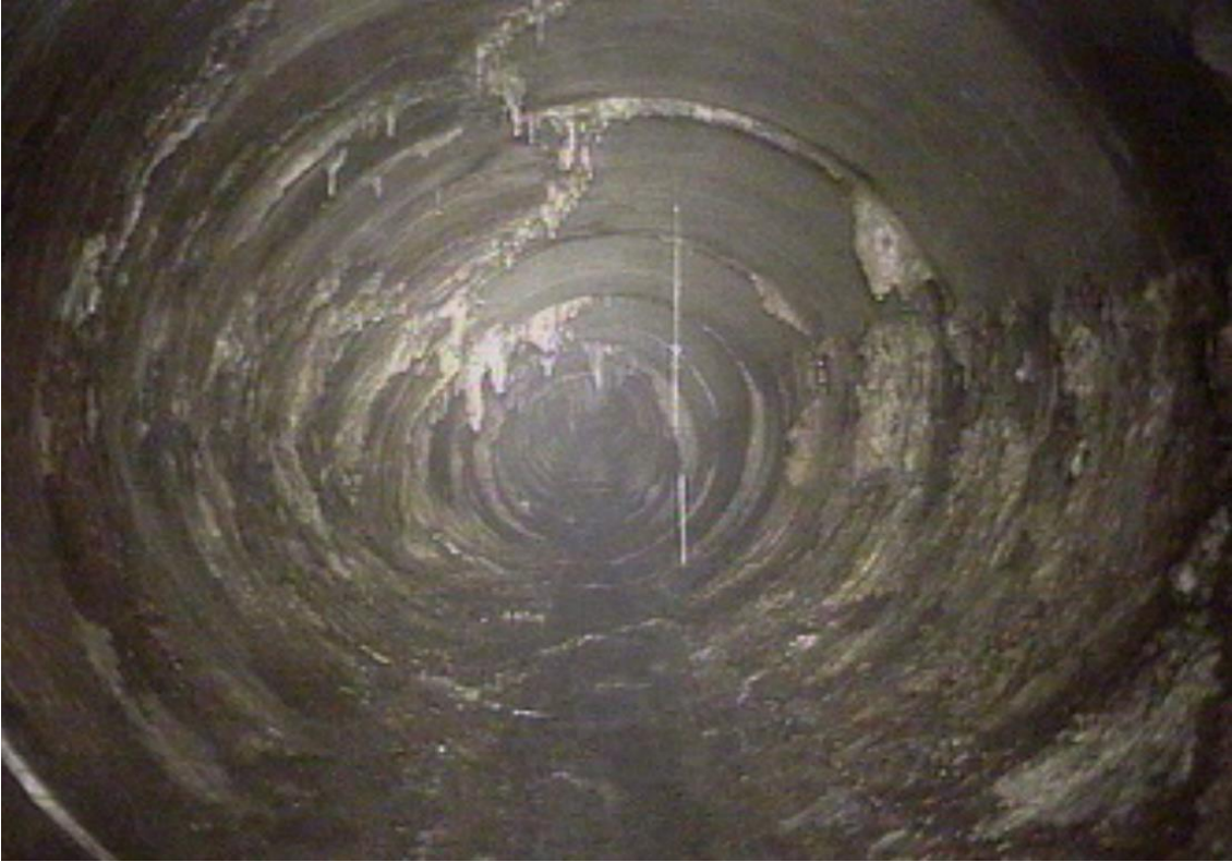
Cassures et écrasement de la conduite, infiltration d'eau polluée (lixiviat) et concrétions liées.