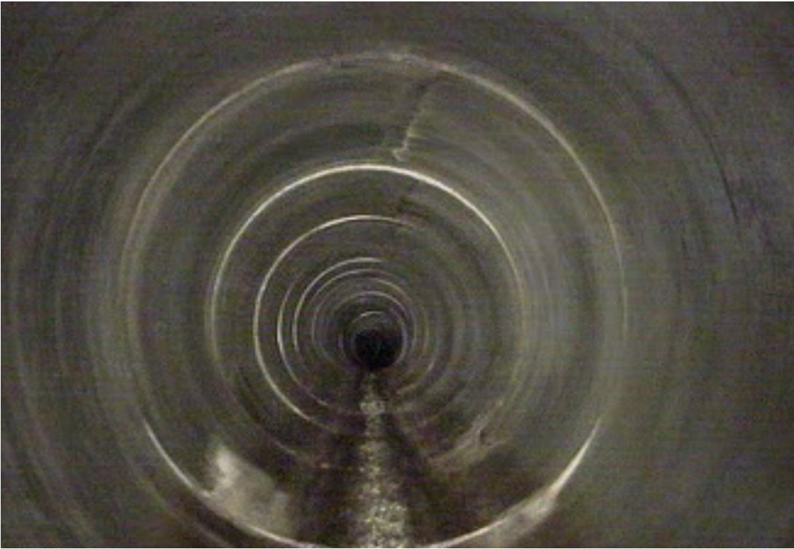
Section de conduite en bon état.