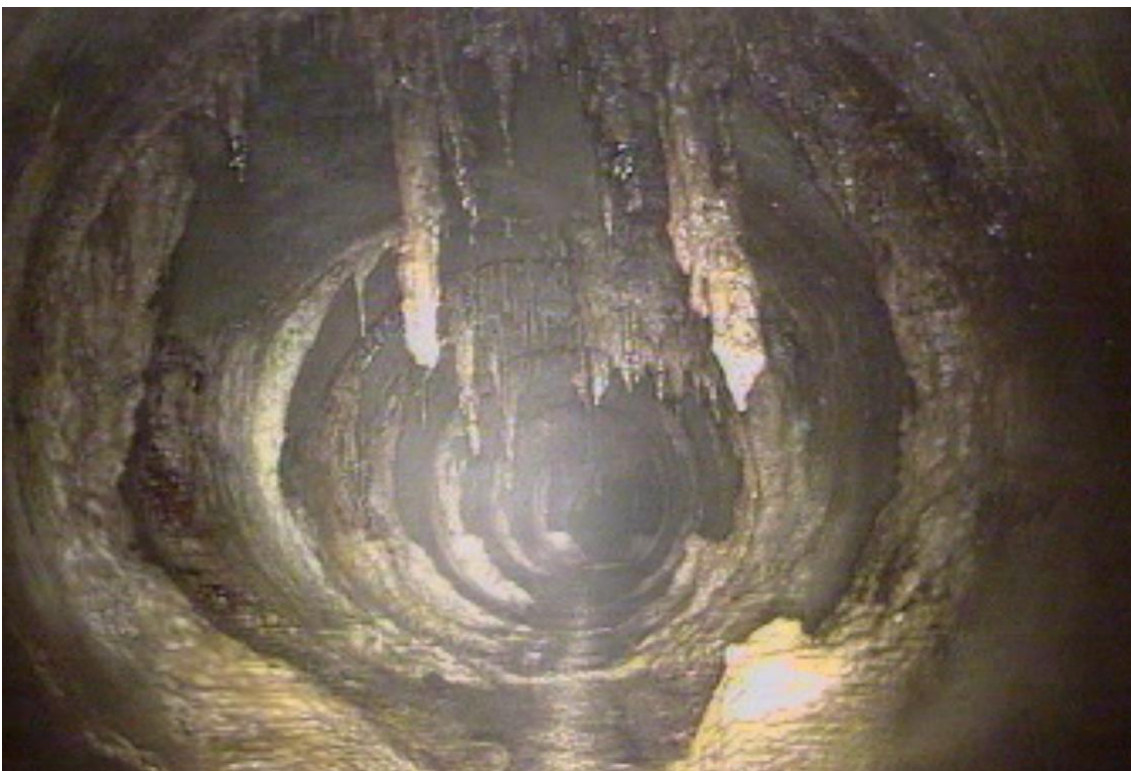
Nombreuses infiltrations de lixiviats de décharge et concrétions associées.