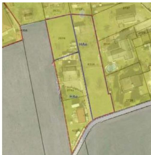
Fig. 2 : Extrait du plan de zone avec orthophoto