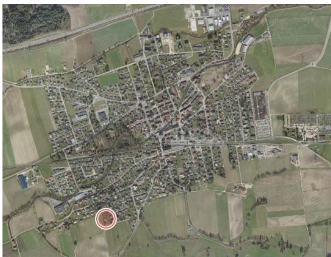
Fig. 1 : Localisation générale du PS « Au Coeudret II »

Les parcelles n°4317, 4318, 2674 et 2741 sont désormais affectées à la zone d'habitation A, secteur e (HAe) et sont soumises à une procédure de plan spécial. Dès lors et suite à l'initiative de l'un des propriétaires fonciers concernés, la procédure de Plan spécial d'équipement de détail a été initiée.