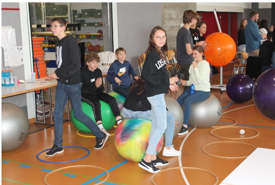
Les élèves de l'école secondaire de Haute-Sorne lors des ateliers participatifs de l'après-midi du 30 septembre dernier, à la halle de gym de Glovelier.