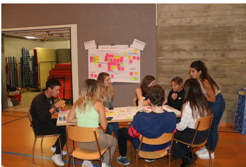
Le soir, ils avaient la parole avant le concert.